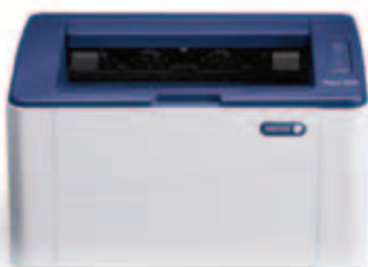
Phaser 3020. הדפסה.